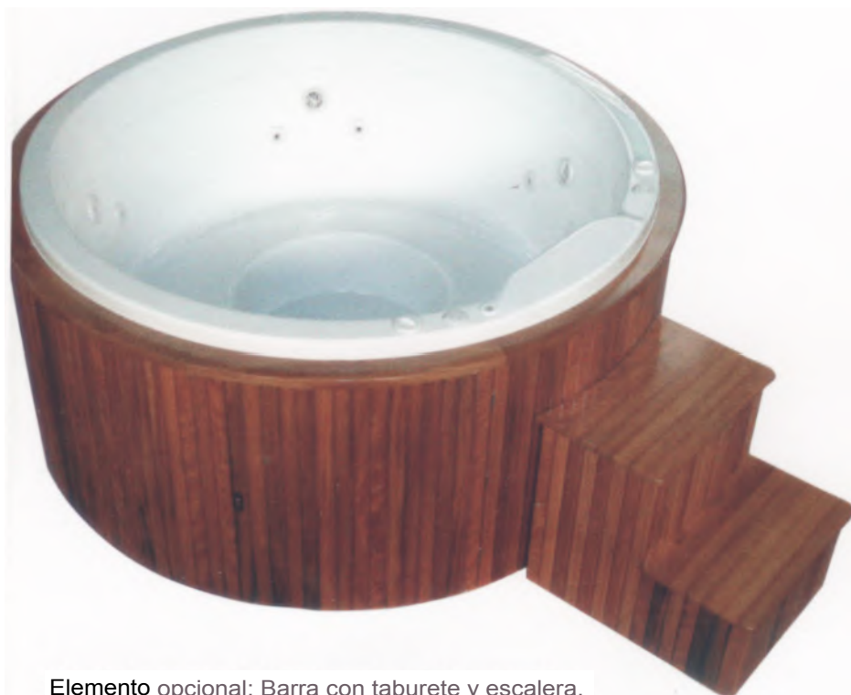
Elemento opcional: Barra con taburete y escalera.